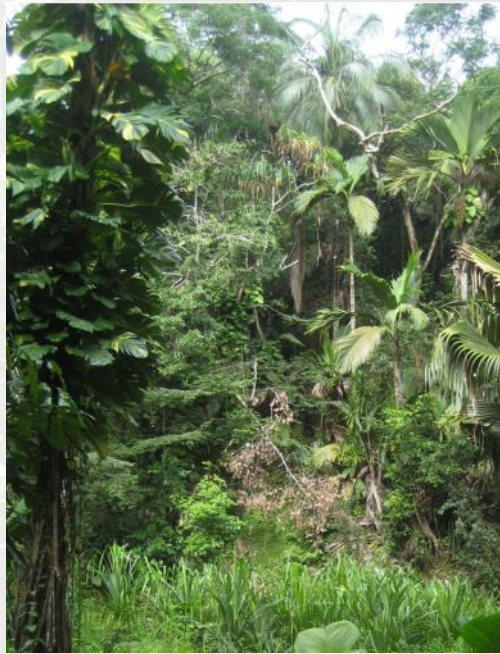
Forêt de palmiers dans la Vallée de Mai, envahie par les plantes introduites.