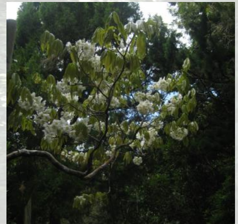
La canopée dans les Zones de gestion pour la conservation à Maurice est constituée principalement d'espèces indigènes.

Inva'Ziles doit trouver un financement de contrepartie de 400 000 €, auquel tous nos partenaires des projets pilotes contribuent. En ce sens, le Service des parcs nationaux et de conservation de Maurice a récemment proposé d'explorer les possibilités de financer entièrement un projet pilote à partir d'autres sources, tandis que les fonds d'Inva'Ziles seront utilisés pour intégrer ce projet dans notre analyse des coûts-bénéfices des espèces envahissantes décrite à la p. 2. Le projet pilote qui a été proposé fait partie du programme des « Zones de gestion pour la conservation » à Maurice, comprenant le contrôle des plantes ligneuses envahissantes (en particulier la Goyave de Chine Psidium cattleianum ) et la restauration de la forêt indigène, dans ce cas à Plaine Raoul dans le PN des Gorges de la Rivière Noire.