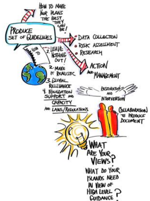
Dessin : Leah Silverman