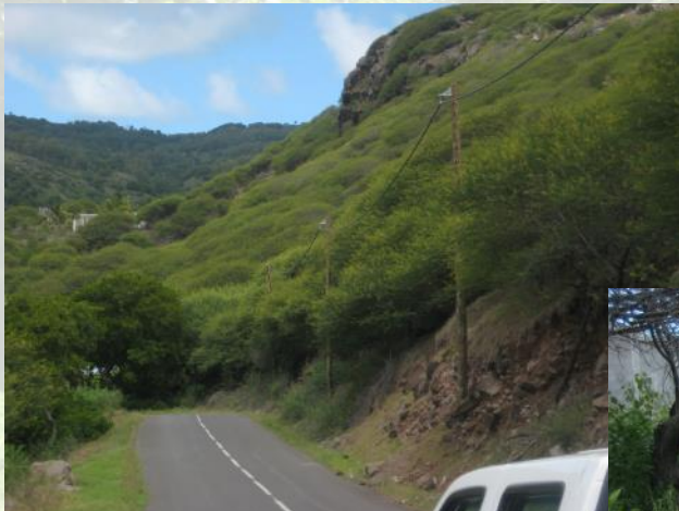
Une colline à Rodrigues, envahie par Pikan Loulou Acacia nilotica .

Le Service forestier de la Commission de l'environnement de Rodrigues (partenaire d'Inva'Ziles à Rodrigues) a mis en place un programme effectif de lutte contre les plantes ligneuses envahissantes, en particulier le Pikan Loulou Acacia nilotica , tout en plantant des espèces indigènes, y compris les endémiques très menacés. L'objectif est de régénérer la forêt indigène sur les zones envahies et dégradées. Le programme couvre des zones protégées gérées par l'État, mais aussi des terres communautaires, où une grande partie du travail est confiée aux groupes communautaires qui profitent ainsi d'un meilleur pâturage. Inva'Ziles contribue à élargir le programme, à lancer un programme de suivi et à affiner les méthodes. Les données qui seront recueillies serviront à faire connaître mondialement le projet et les succès remarquables de conservation obtenus à Rodrigues, en espérant ainsi attirer davantage de fonds.