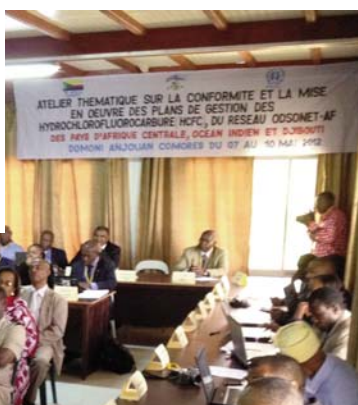
Ouverture de l'atelier