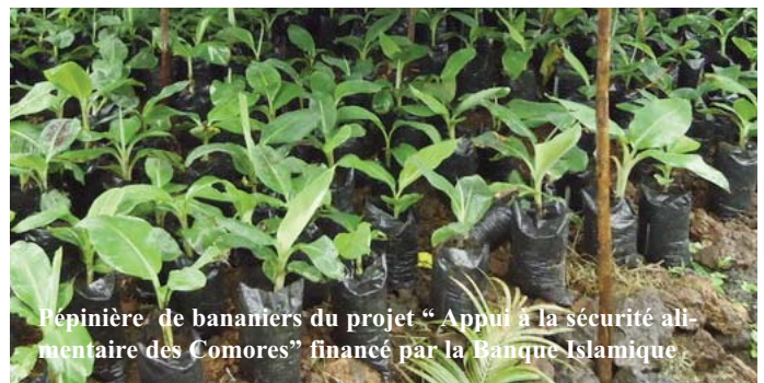
Pépinière de bananiers du projet "Appui à la sécurité alimentaire des Comores" financé par la Banque Islamique