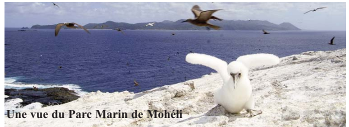
Une vue du Parc Marin de Mohéli

"Nous aimerions voir les industriels et les milieux d'affaires d'Oman se lancer dans une collaboration stratégique possible avec les Comores. Nous devons réfléchir aux moyens de renforcer les relations économiques mutuelles et les échanges avec les Comores," a noté Al Ahsani.