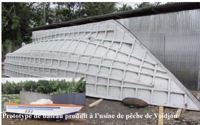
Prototype de bateau produit à l'usine de pêche de Voidjou