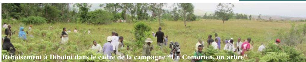
Reboisement à Diboini dans le cadre de la campagne "Un Comorien, un arbre"