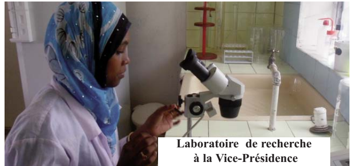
Laboratoire de recherche à la Vice-Présidence

Anjouan: Localités nouvellement électrifiées Les localités de Vouani, Badrani ya Vouani, Marotroni, Salamani ya Dzindri, Iméré et Dar- Salama viennent d'être électrifiées.