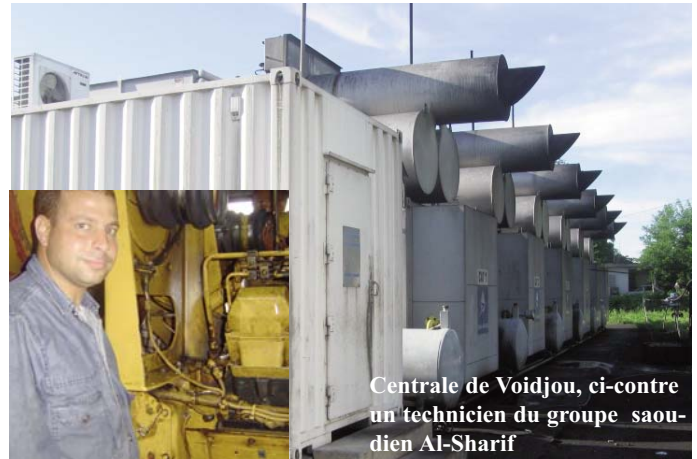
Centrale de Voidjou, ci-contre un technicien du groupe saoudien Al-Sharif