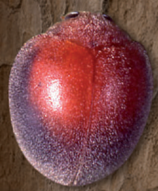
Thành trùng của bọ rùa Rodolia

Các loài săn mồi (bắt và ăn thịt các con mồi) rất hiệu quả trong việc tiêu diệt các loài côn trùng gây hại mùa màng