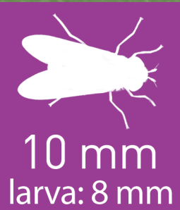
Thành trùng của loài ruồi ăn rệp