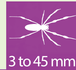
Nhện sói (wolf spider)