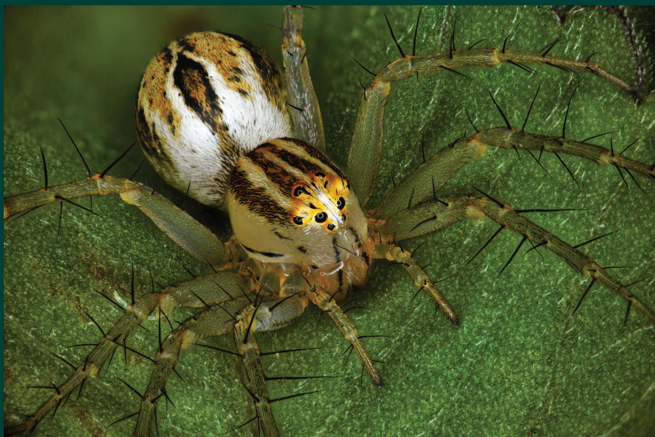
Nhện linh miêu Oxyopes săn nhiều loại côn trùng gây hại