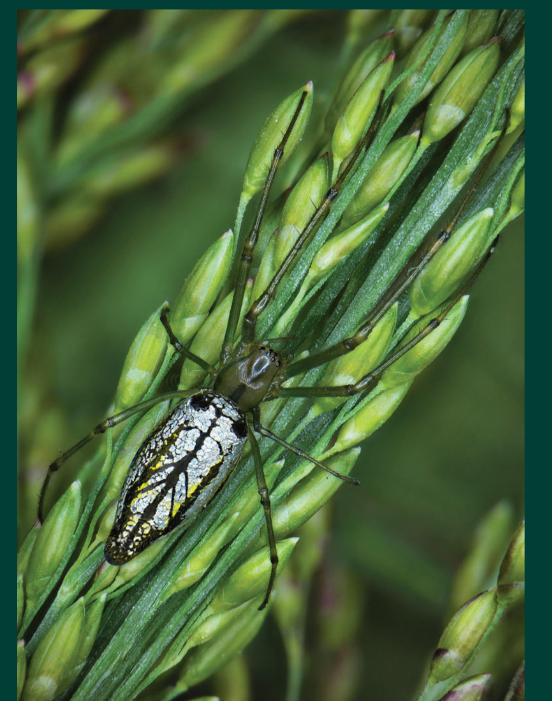
Nhện vườn giăng lưới bắt nhiều loài côn trùng gây hại