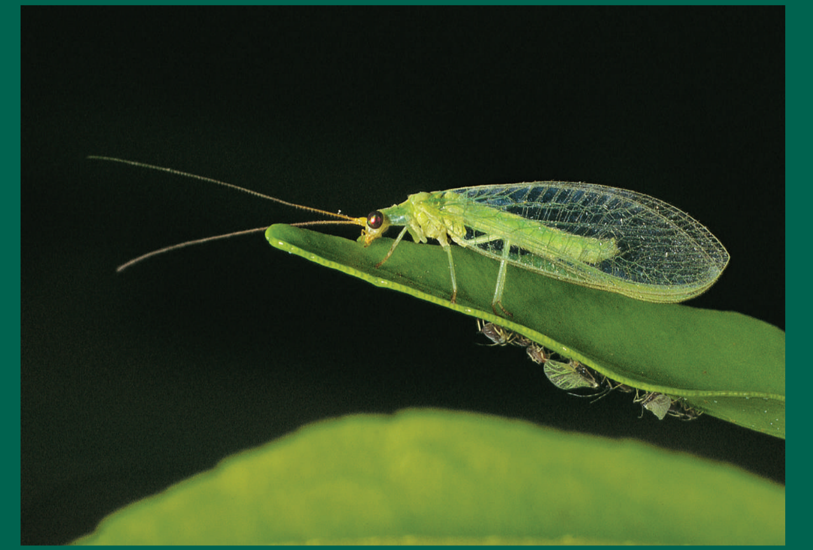
Bộ cánh lưới bắt mồi nhiều loài côn trùng gây hại