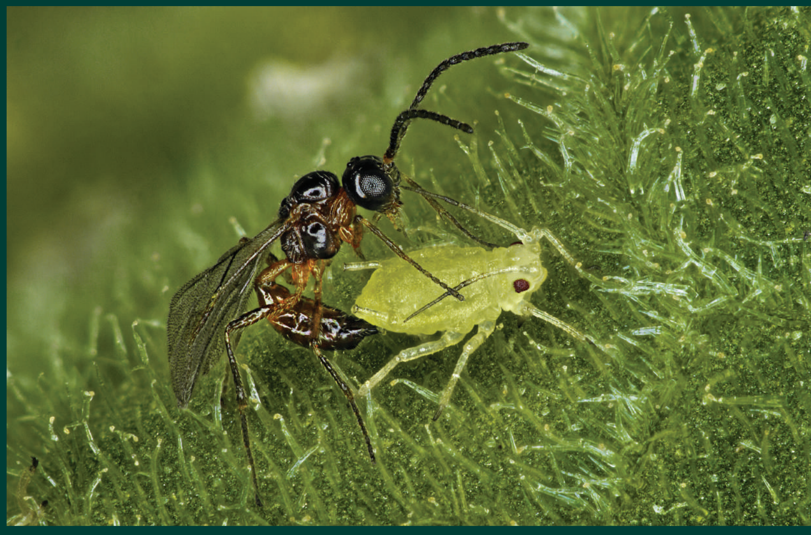
Ong ký sinh ký sinh rầy mềm