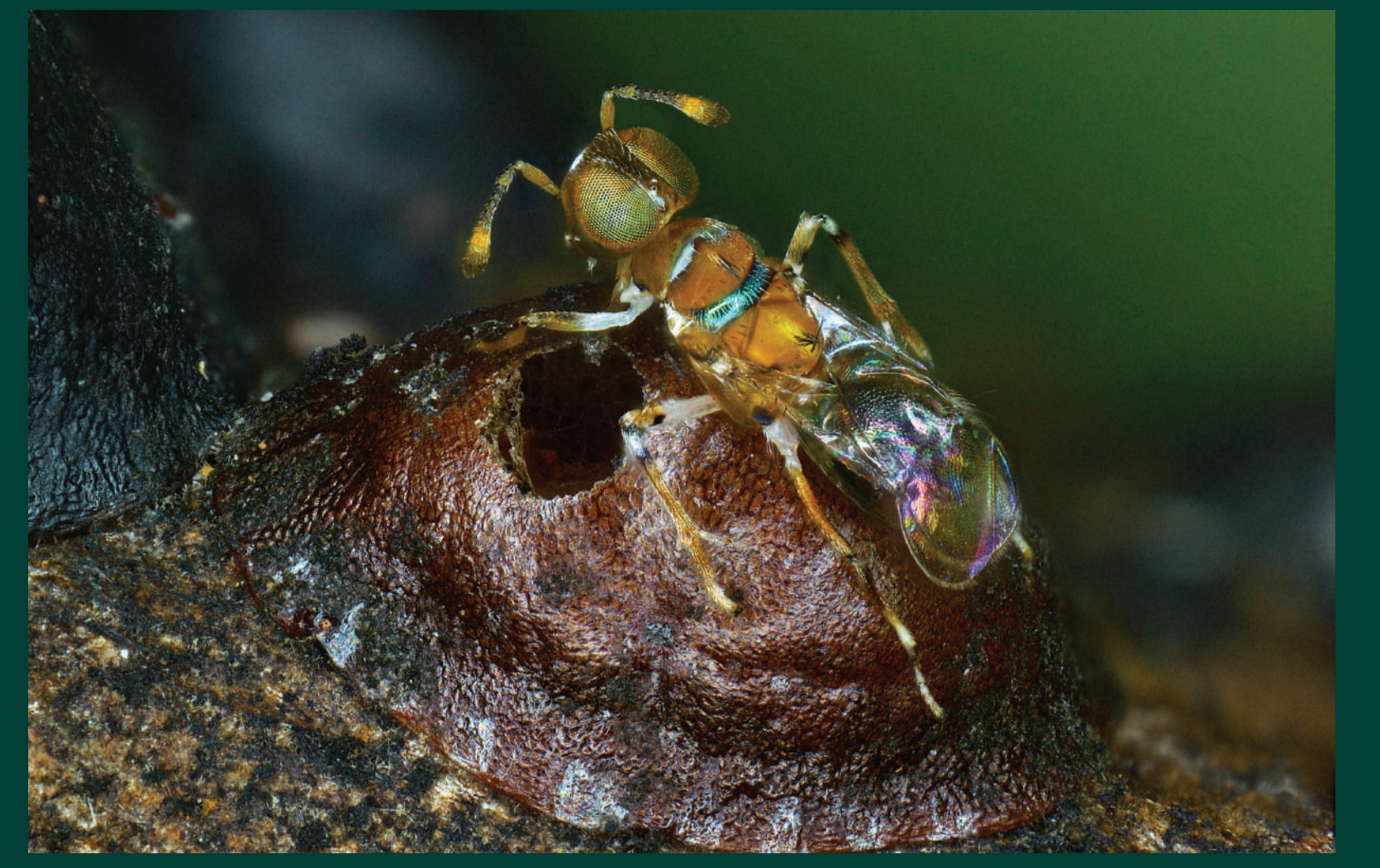
Ong ký sinh ký sinh rệp sáp