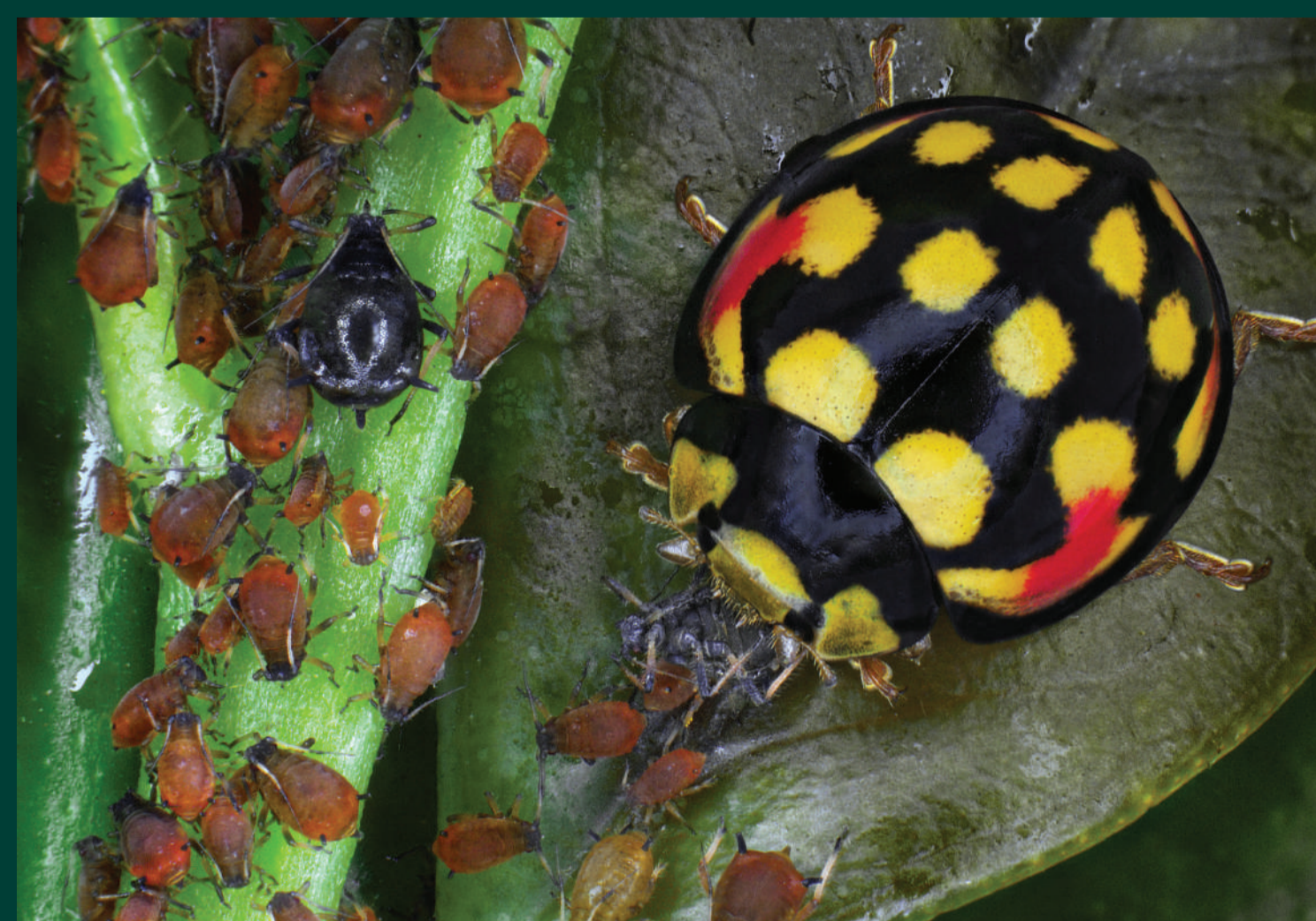
Bộ rùa đang ăn mồi là rầy mềm