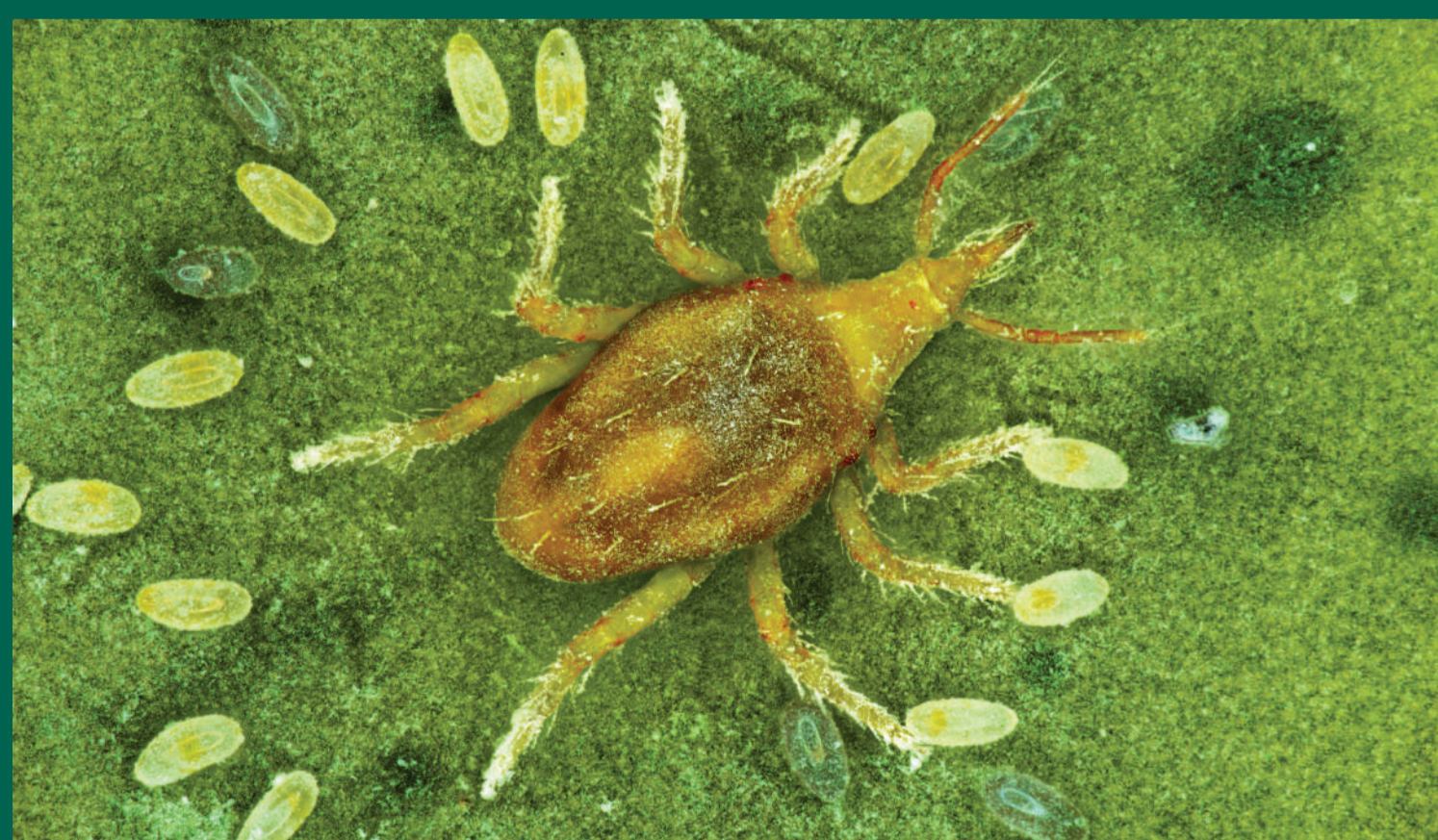
Nhện nhỏ bắt mồi Bdelodes ăn nhện ký sinh và bọ trĩ