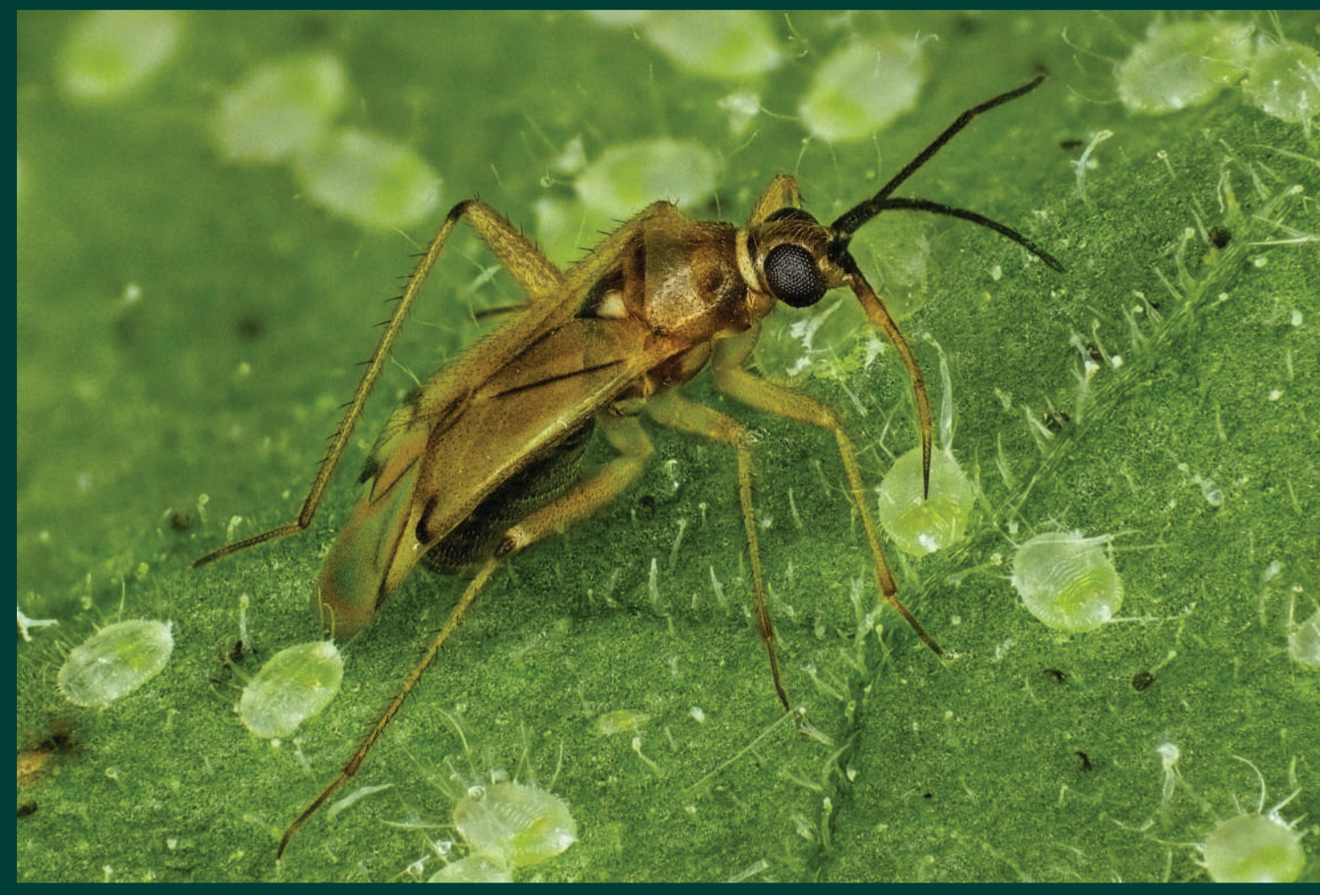
Bộ xít bắt mồi Orius ăn mồi là nhện ký sinh và bọ trĩ