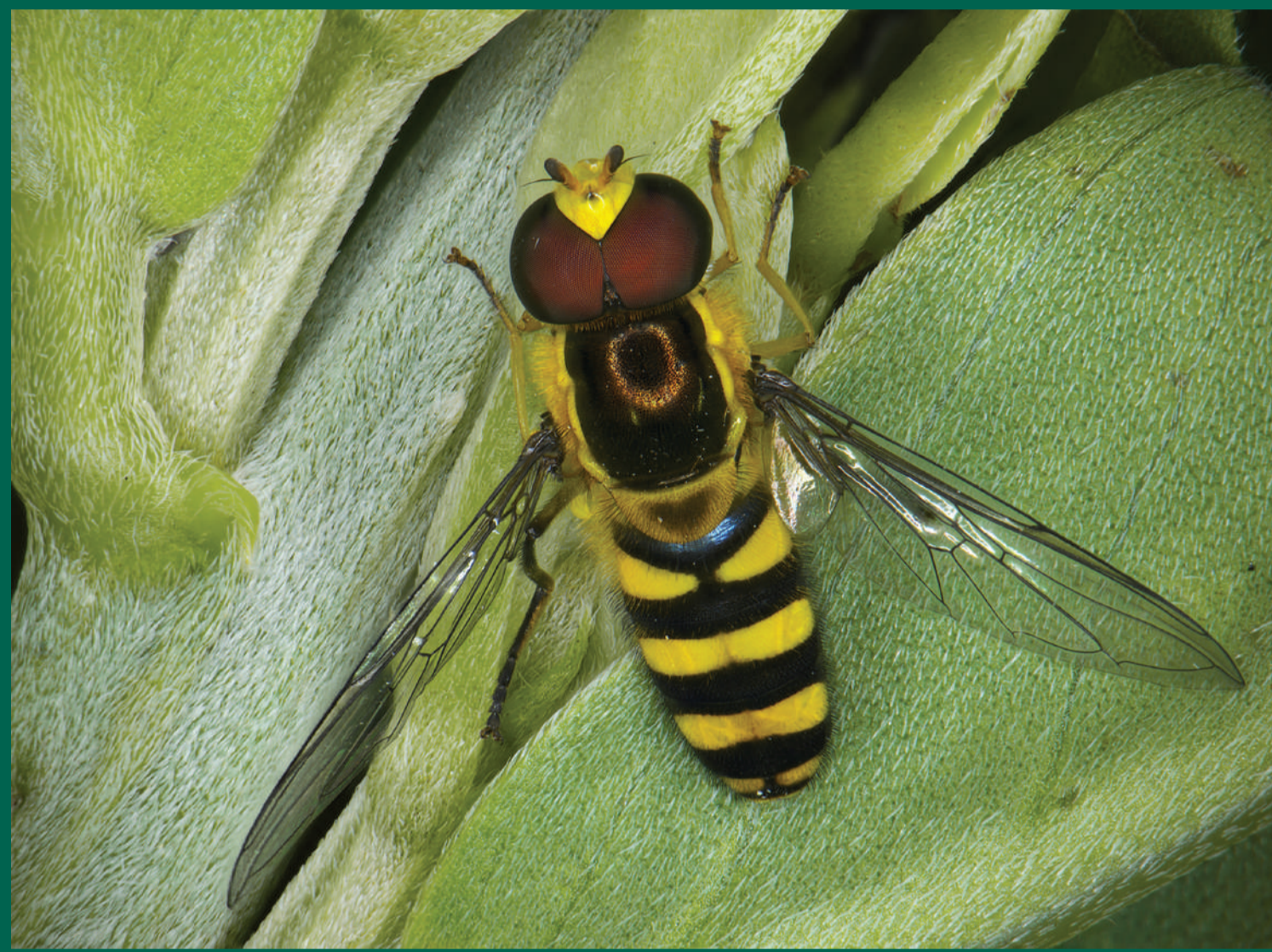
Ruồi ăn rệp Ischiodon : Giai đoạn trưởng thành giúp thụ phấn, giai đoạn nhộng ăn rầy mềm