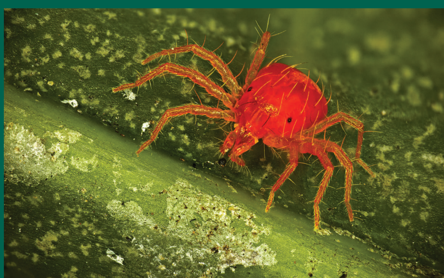
Nhện nhỏ ăn nhiều loài gây hại