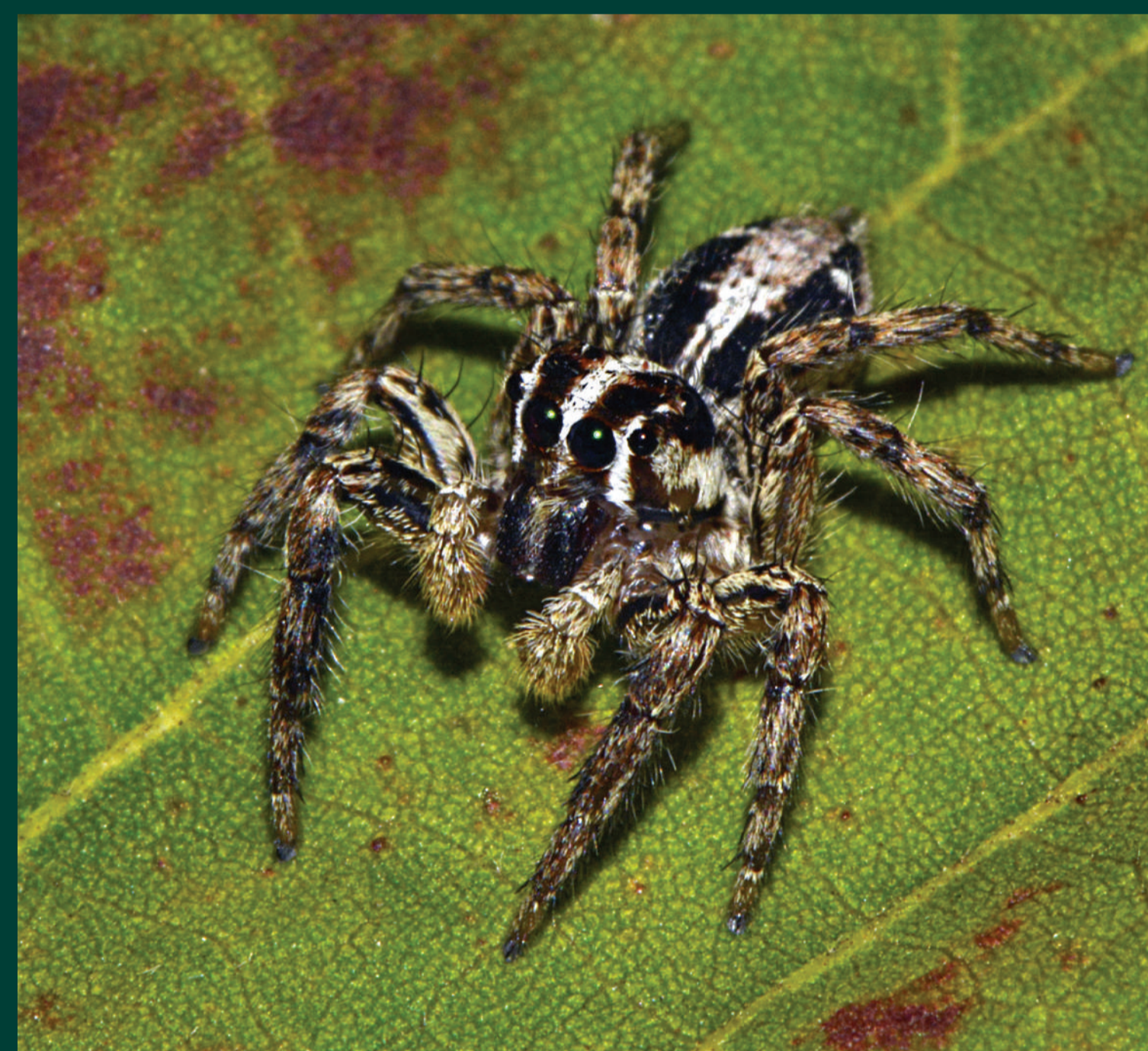
Nhện nhảy săn rất nhiều loài côn trùng gây hại