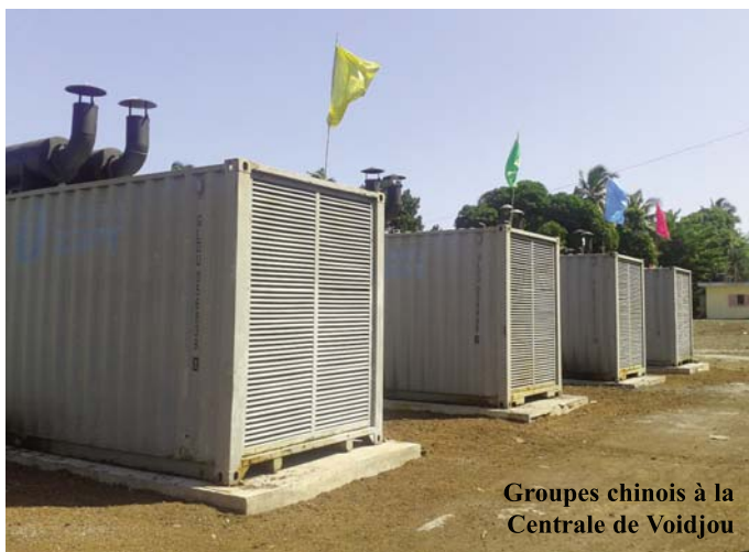
Groupes chinois à la Centrale de Voidjou