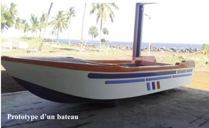
Prototype d'un bateau

- Réalisation d'une première phase de négociations