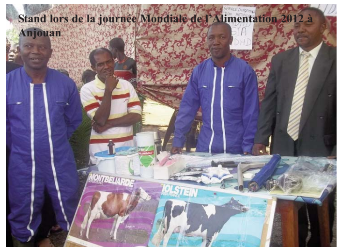
Stand lors de la journée Mondiale de l'Alimentation 2012 à Anjouan