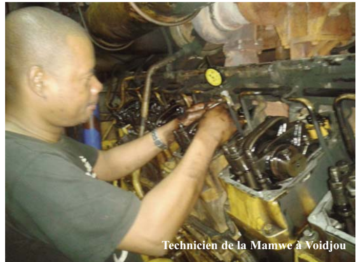
Technicien de la Mamwe à Voidjou