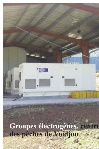
Groupes électrogènes, centre des pêches de Voidjou