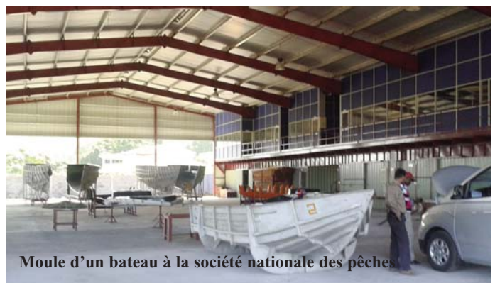
Moule d'un bateau à la société nationale des pêches

de deux DCP d'expérimentation (Baie de Mutsamudu)