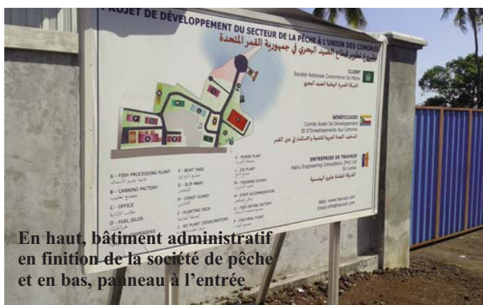
En haut, bâtiment administratif en finition de la société de pêche et en bas, panneau à l'entrée