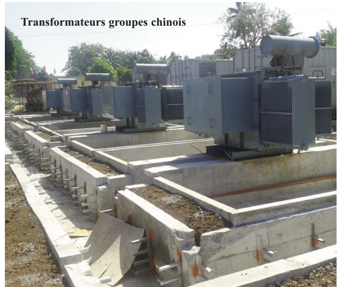
Transformateurs groupes chinois

Signature d'un contrat d'exploration avec une société.