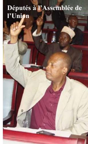
Députés à l'Assemblée de l'Union