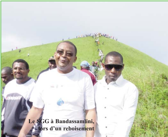
Le SGG à Bandassamlini, lors d'un reboisement