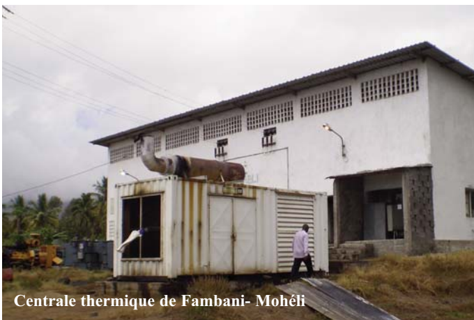
Centrale thermique de Fambani- Mohéli

solaires destinés aux populations nécessiteuses en milieu rural.