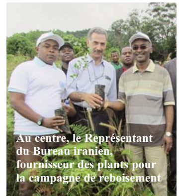
Au centre, le Représentant du Bureau iranien, fournisseur des plants pour la campagne de reboisement