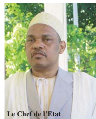
Le Chef de l'Etat