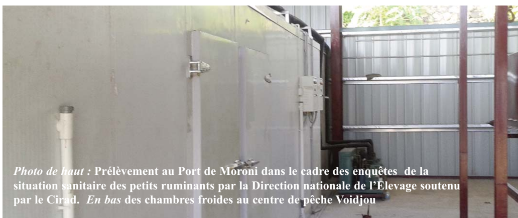
Photo de haut : Prélèvement au Port de Moroni dans le cadre des enquêtes de la situation sanitaire des petits ruminants par la Direction nationale de l'Elevage soutenu par le Cirad. En bas des chambres froides au centre de pêche Voidjou

les CRDE et lancement de DAO pour l'acquisition d'autres motos.