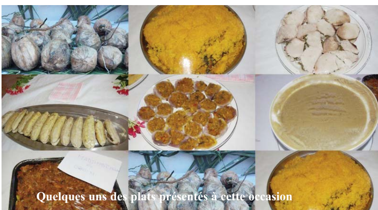
Quelques uns des plats présentés à cette occasion

La Ministre de la santé et le Représentant de l'OMS