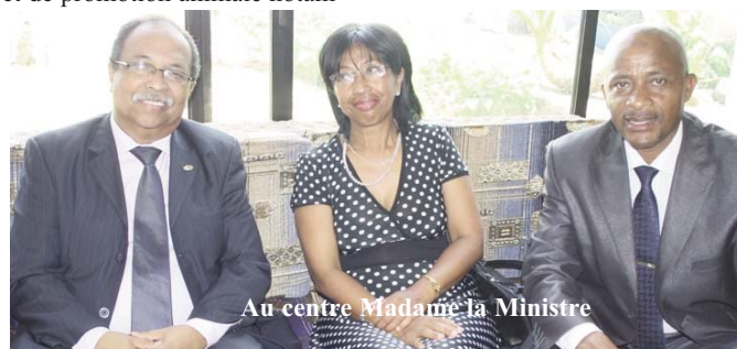
Au centre Madame la Ministre