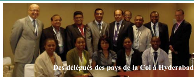
Des délégués des pays de la Coi à Hyderabad

Parmi les autres résultats de la rencontre, les aires marines riches en biodiversité reçoivent une attention particulière.