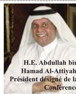
H.E. Abdullah bin Hamad Al-Attiyah, Président désigné de la Conférence